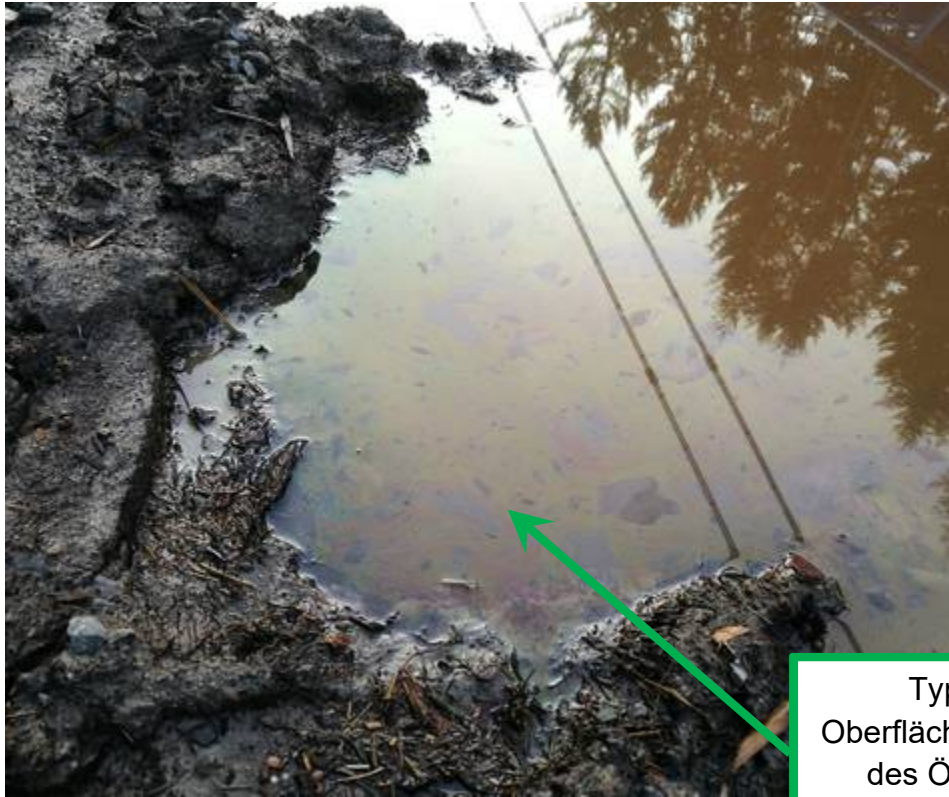
Typische Oberflächenreflektion des Ölfilms auf Wasser