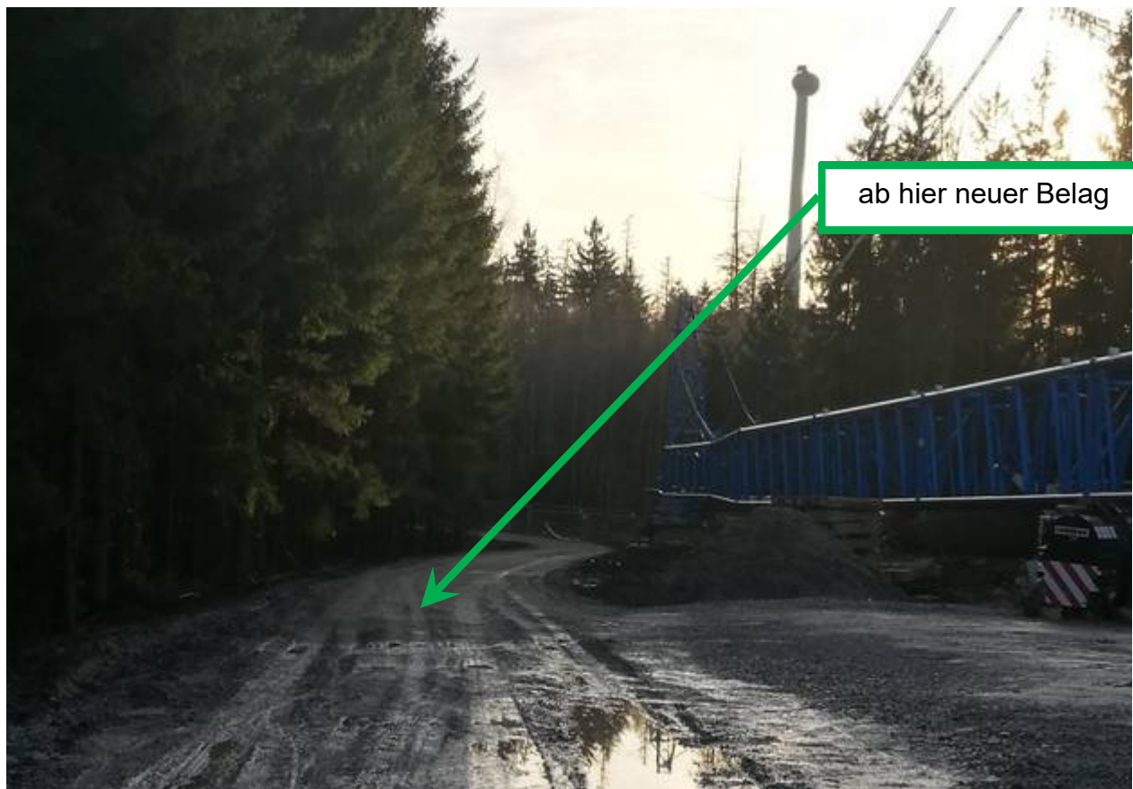
ab hier neuer Belag